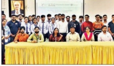
महत्वाकांक्षी उद्यमियों को कई प्रतिभागियों में एक साथ लाया गया। इसमें एक बेहतर कल की पेंटिंग (क्रिएटिव पोस्टर

रांची। इक्फाई विश्वविद्यालय, झारखंड को इंस्टीट्यूट ऑफ इनोवेशन काउंसिल (आईआईसी) ने 17 से 20 अगस्त 2025 तक तीन दिवसीय मेगा इवेंट ड्रीम-2 विन - उद्यमिता चुनौती 2025 का सफलतापूर्वक आयोजन किया, जिसका समापन 21 अगस्त 2025 को विश्व उद्यमी दिवस 2025 के उत्सव के साथ हुआ। इस कार्यक्रम में नवीन नवप्रवर्तकों और